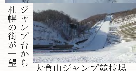
大倉山ジャンプ競技場